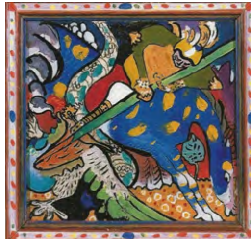
San Jorge y el dragón (1911)