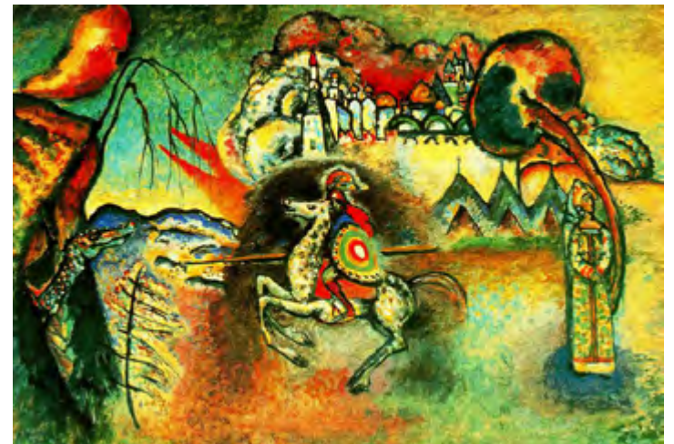
San Jorge y el dragón (1927)